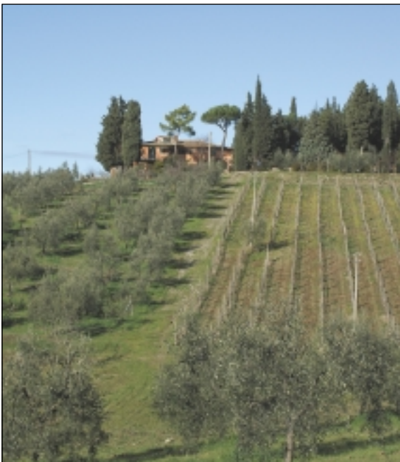
Et typisk billede af et toscansk landbrug: Oliven, vin og cypresser på en lille bakke.

I Toscana er forholdet mellem landbrugsbedriftenes størrelse og det areal, den enkelte gård dyrker, meget skævt sammenlignet med Danmark. Toscana er de små landbrugsbedrifters land. Næsten 80% af gårdene i Toscana er mindre end 5 ha, og de dyrker kun 4,7% af det opdyrkede