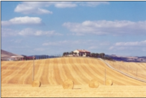
Mange toscanske landejendomme ligger på toppen af små bakkedrag i det åbne land.

større og specialiserede gårde opkøber de mindre landbrug.