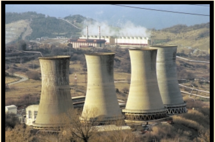
Valle Seccolo kraftværket forsynes med geotermisk damp fra 35 brønde i Larderello området. Væsken transporteres frem til kraftværket gennem et netværk af 16 km rørledninger med en diameter på over 1 m.