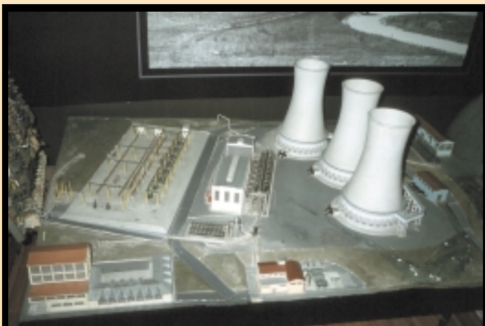
På det geotermiske museum er områdets geologi og historie gennemgået på plancher og modeller.

Besøget er gratis. Bemærk at de ansatte på anlæggene i Larderello næsten udelukkende taler italiensk.