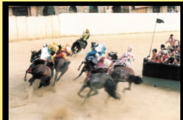
Der kæmpes så hårdt om sejren, at der næsten hvert år sker styrt så heste må aflives.

Palioen er også et farligt hestevæddeløb. Der skal rides uden sadel, så der sker ofte styrt undervejs. De sidste 25 år er 40 heste blevet aflivet på grund af styrt. Det har fået italienske miljøgrupper og grønne partier til at kræve løbet forbudt. Men foreløbig har der ikke været flertal for at forbyde løbet. Efter væddeløbet fortsætter festlighederne i contradaernes gader og kulturcentre, hvor middagen kan være en anledning til at feste eller det modsatte, afhængigt af dagens resultat. Hvis man ikke har mulighed for at se Palioen, findes der biografer i byen, hvor det er muligt at gense den seneste Palio.