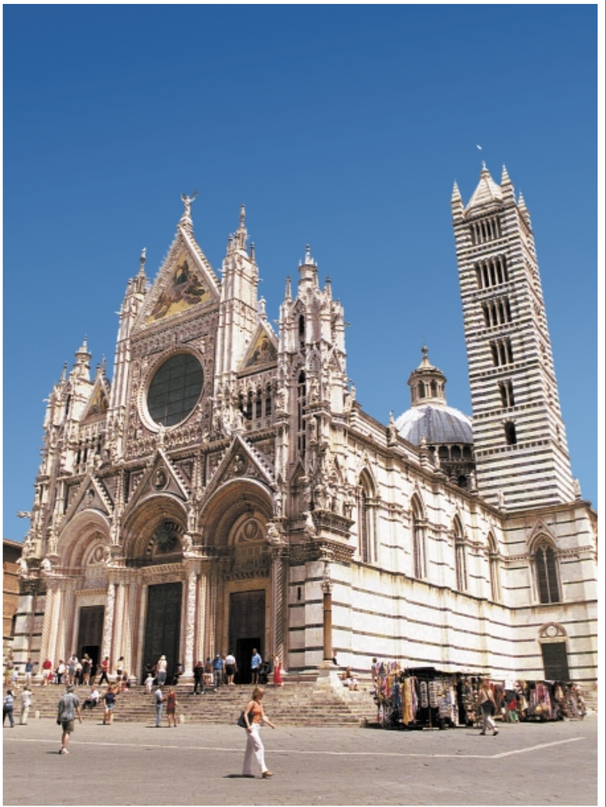
Duomo Santa Maria