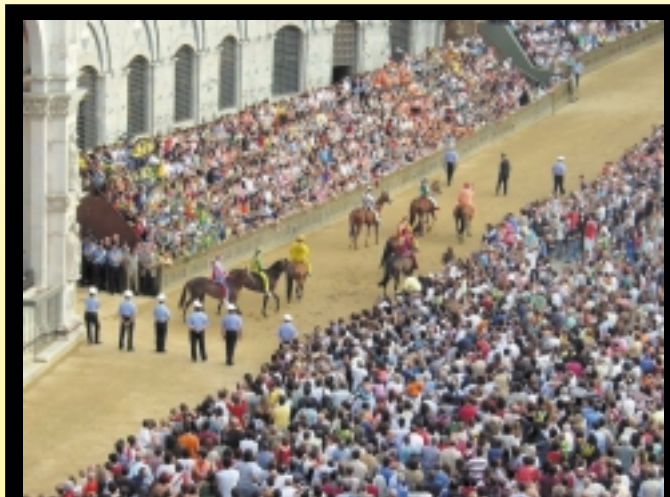
Der er trængsel på Campoen, hvor op mod 50.000 mennesker er stuvet sammen de to gange om året, der er Palio.

Siena er opdelt i 17 forskellige bydele ( contrada ) med hver sit eget flag, sin egen farve, sin egen kirke, sin egen helgen, fontæne, bar, museum, og naturligvis sit eget navn: Tårnet, Skilpadden, Næsehornet, Panteren, Muslingen, Bølgen, Gåsen, Vædderen, Hunulven, Enhjørningen, Pindsvinet, Dragen, Giraffen, Uglen, Sneglen, Larven og Ørnen. Symbolerne har hver sin historie og er hentet fra ældgamle familier eller bedrifter. Der er kun plads til 10 contradaer i