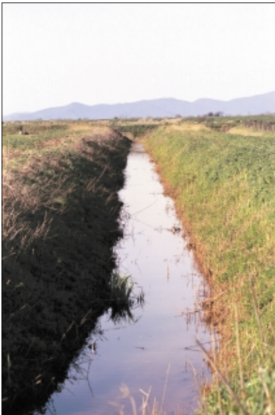
Afvandingskanal i Maremma.

Storhertugen af Toscana, Leopold II , iværksatte i 1828 de første jordforbedringsarbejder med af-