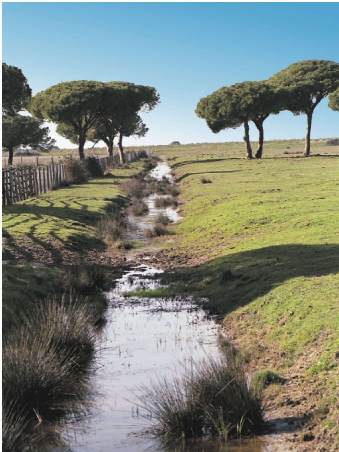
Parco Naturale dell'Uccellina