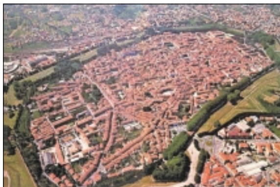
Lucca set ovenfra.

Lucca er en stille og hyggelig toscansk by med 92.500 indbyggere, beliggende 70 km vest for Firenze. Det gør Lucca charmerende, at dens centrale del ligger isoleret inden for en massiv, velbevaret bymur, som begrænser trafikken i byens centrum. Selv om byen kun er godt én km på den længste led, tæller den mere end 20 kirker, mange fredelige brolagte gader, små museer og talrige hyggelige små restauranter.