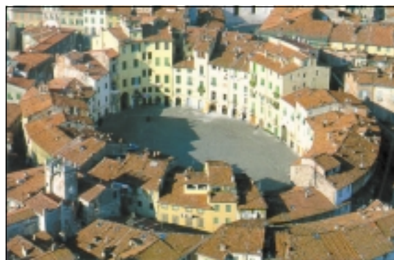
Piazza del Anfiteatro, hvor den gamle romerske arena lå.

Lucca blev grundlagt i år 180 f.kr. som en blomstrende romersk koloni under det antikke Rom.