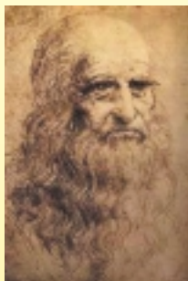
Leonardo da Vinci, 'Selvportræt', 1515

Leonardo regnes i højere grad end Michelangelo og Rafael som kunstner i 'højrenæssancen'. Der er kun bevaret omkring 15 af hans malerier, hvoraf flere er ufuldførte.