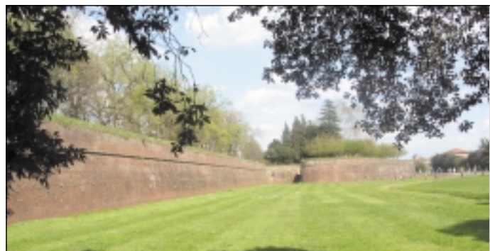
Bymuren og grønsværen som omkranser Lucca.

Luccas gamle bymur modstod i middelalderen talrige erobringforsøg fra Firenzes side. Men en ny våbentechnologi i renæssancen førte til, at kampene ændrede sig fra at være offensive til at være defensive. Derfor byggede man i årene 1504-1645 et nyt forsvarsværk rundt om Lucca. Den gamle bymur blev revet ned, og man byggede en ny 4,2 km lang, 12 m høj og 30 m bred bymur i rødsten. Foran muren blev der placeret 11 kanonbastioner ( baluardi ) som skulle beskyde angribende fjender. Foran muren anlagde man en ca. 200 m bred grønsvær, så fjenden ikke kunne finde ly. Midt på denne grønsvær gravede man en 35 m bred voldgrav fyldt med vand. Dette nye og imponerende forsvarsværk var tydeligvis inspireret af Michelangelos planer og regnes i dag for et af Europas bedst bevarede forsvarsværker fra renæssancen.