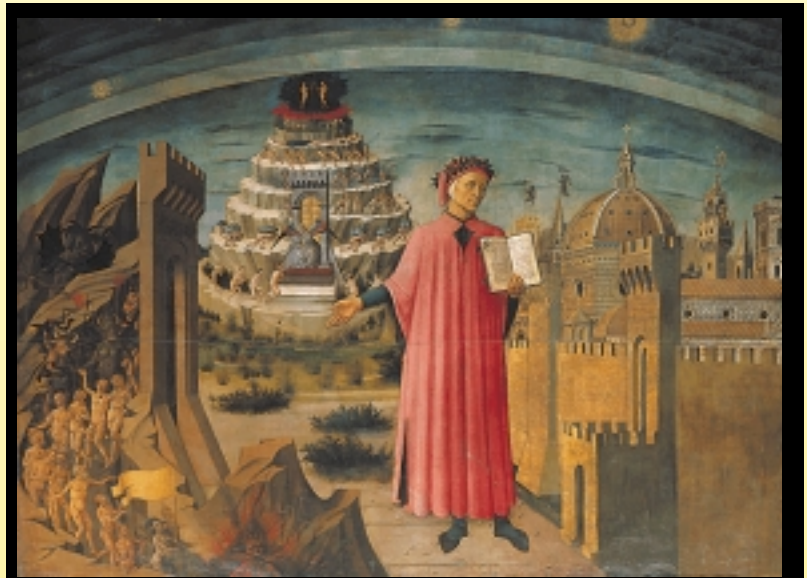
Domenico de Michelino malede i 1465 Dante stående med "Divina Commedia" i hånden uden for fødebyen Firenze, hvorfra han var forvist. Til venstre vandrer de fortabte til Helvede.

I Divina Comedia foretager Dante en rejse gennem tre riger: Helvede, Skærsilden og Paradis. På sin vej møder han mange mytologiske væsener, historiske personer fra den klassiske oldtid og mennesker fra sin egen tid med både venner og fjender fra Firenze.