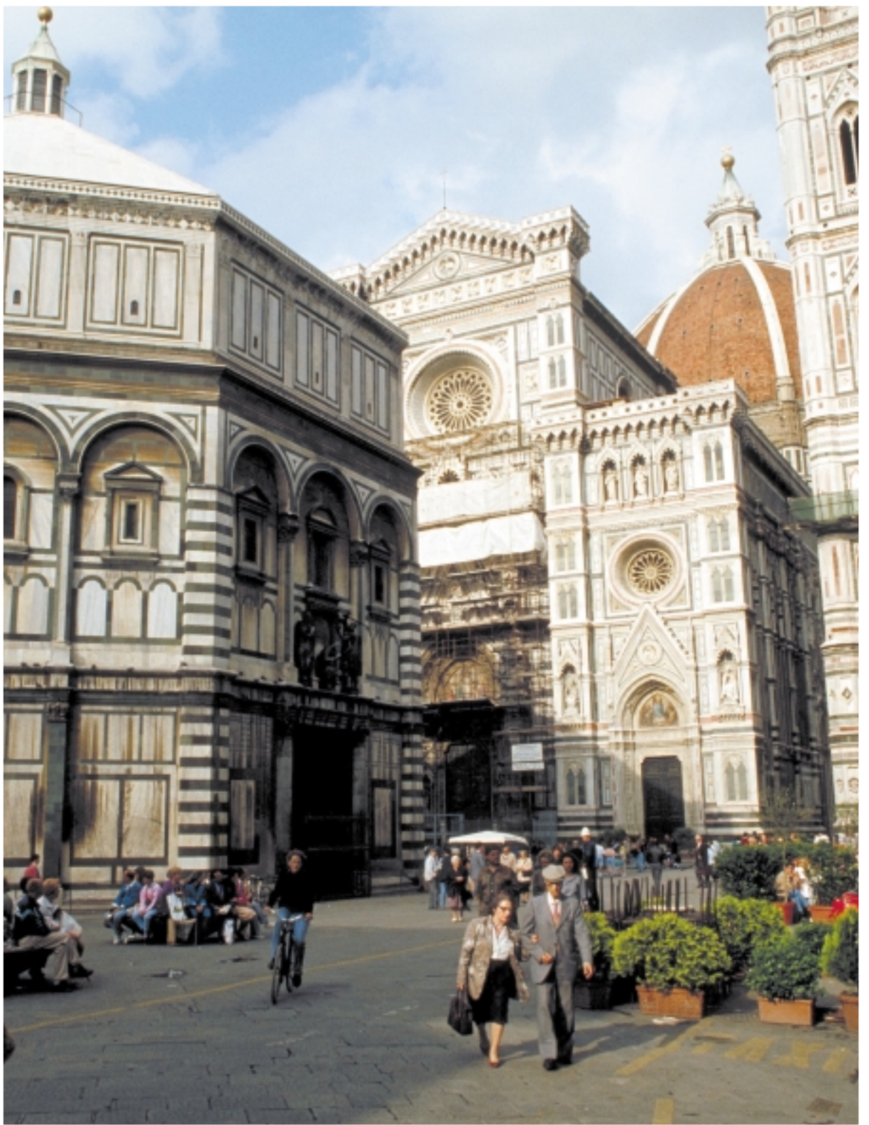
Piazza del Duomo, Firenze